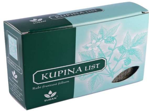
Slika 4. a) List kupine; b) Čaj od lista kupine