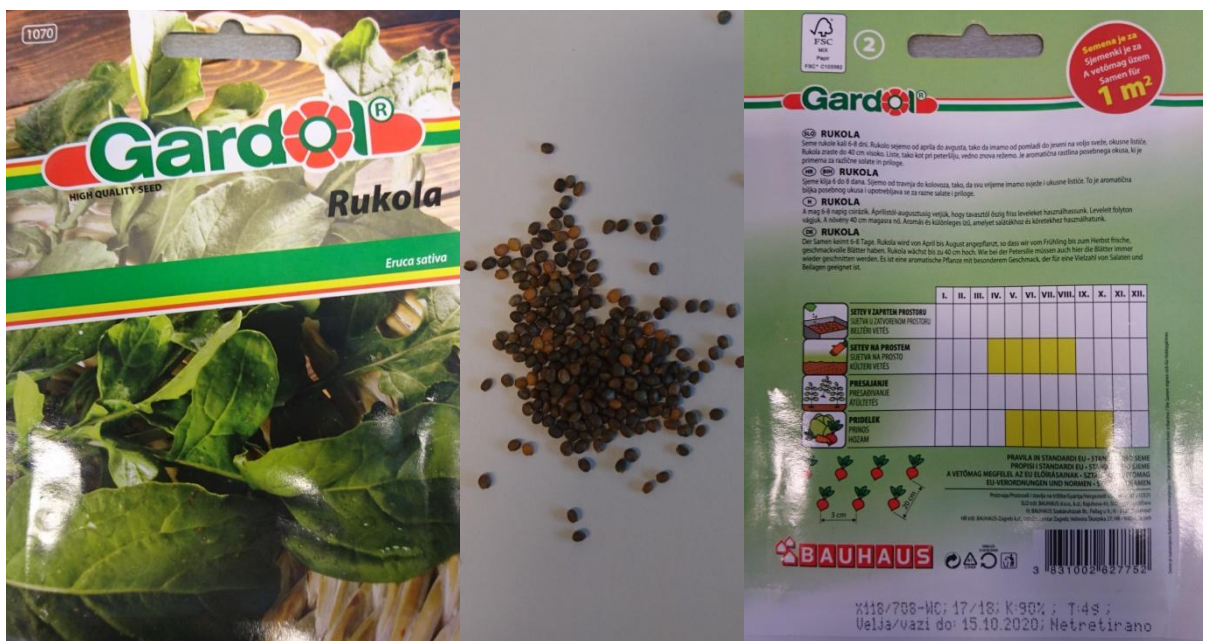
Slika 2.2. Sjeme rukole ( Eruca sativa Mill.)