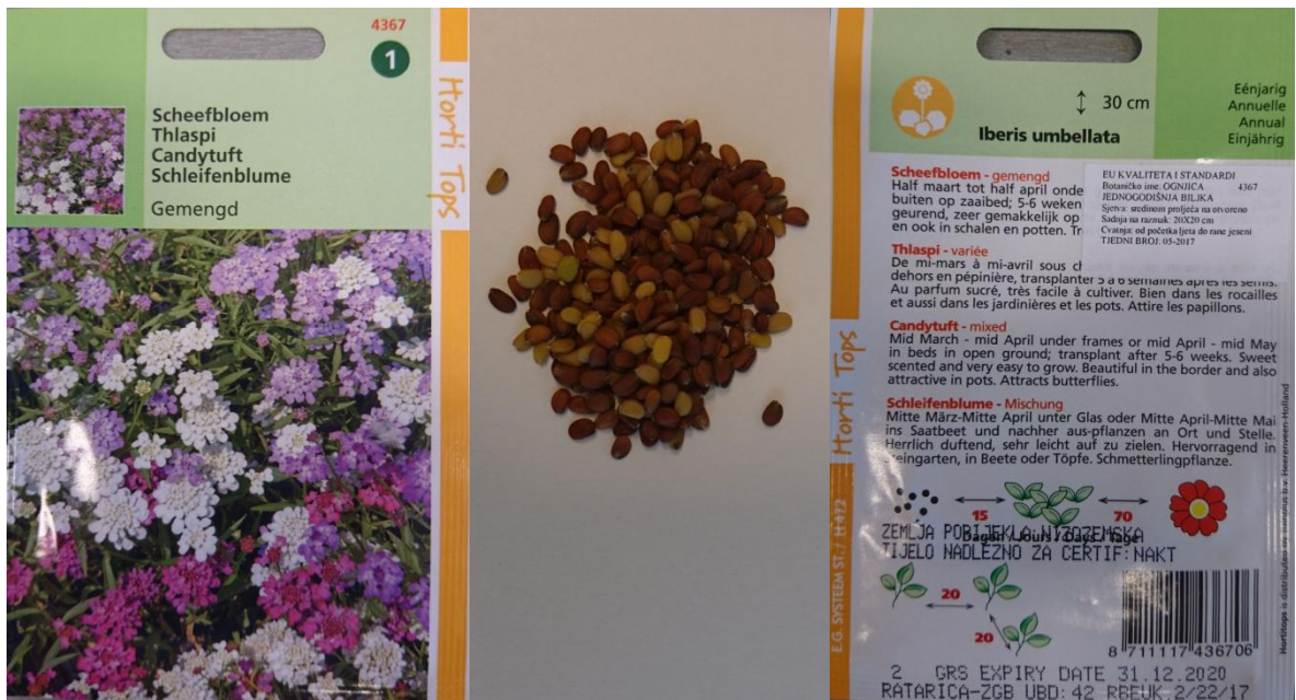
Slika 2.1. Sjeme štitaste ognjice ( Iberis umbellata L.)

U eksperimentalnom dijelu rada korištene su sjemenke štitaste ognjice ( Iberis umbellata L.) proizvođača Tuinplus b. v. Heerenveen, Nizozemska (slika 2.1.) i rukole ( Eruca sativa Mill.) proizvođača Bauhaus-Zagreb k.d., slika 2.2.