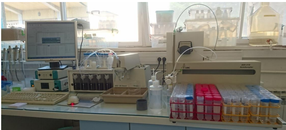
Slika 2.4. \mu Autolab III potencijostat (Metrohm-Autolab)