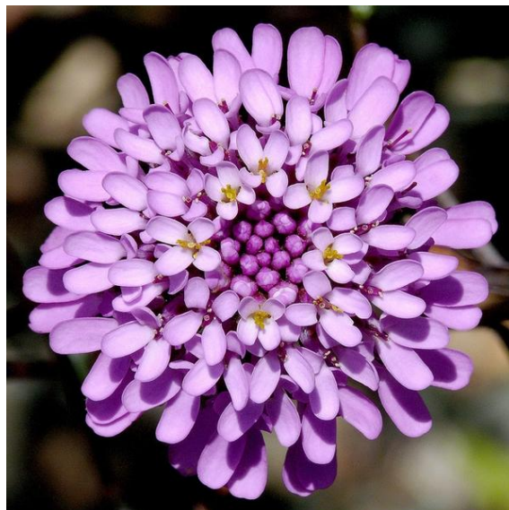
Slika 1.1. Štitasta ognjica 1

Stabljika je zakrivljena u podnožju dok su grane uspravne. Ove biljke dosegnu visinu od 30 do 50 centimetara. Čašica cvijeta je ljubičaste boje dok su latice ljubičaste, bijele i ružičaste boje. Razdoblje cvatnje je od svibnja do lipnja, cvjetovi su dvospolni i oprašuju ih pčele i leptiri. Raste većinom u Europi, najviše uz obalu, od Španjolske do Grčke te Sjeverne Amerike. 1 Na slici 1.1. prikazana je štitasta ognjica.