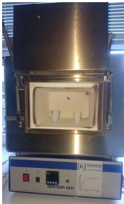
Slika 2.6. Uzorci pripremljeni za žarenje u peći na 500 °C