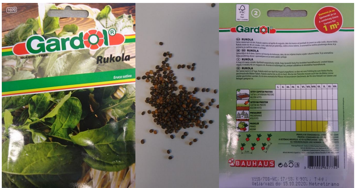
Slika 2.2. Sjeme rukole ( Eruca sativa Mill.)