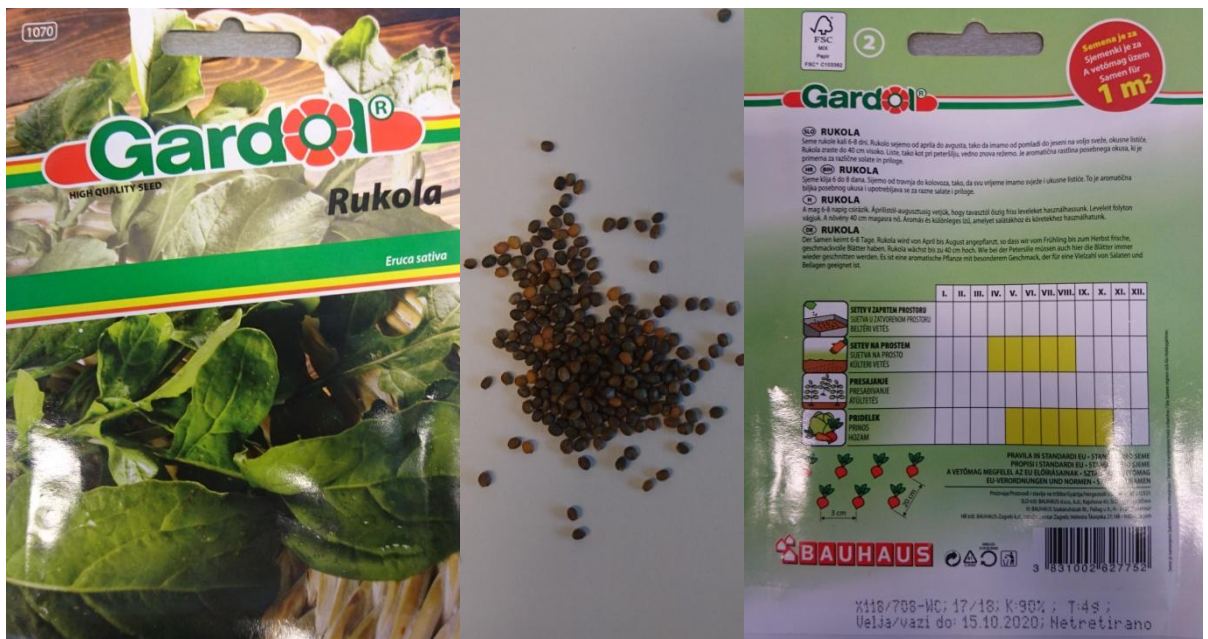
Slika 2.2. Sjeme rukole ( Eruca sativa Mill.)