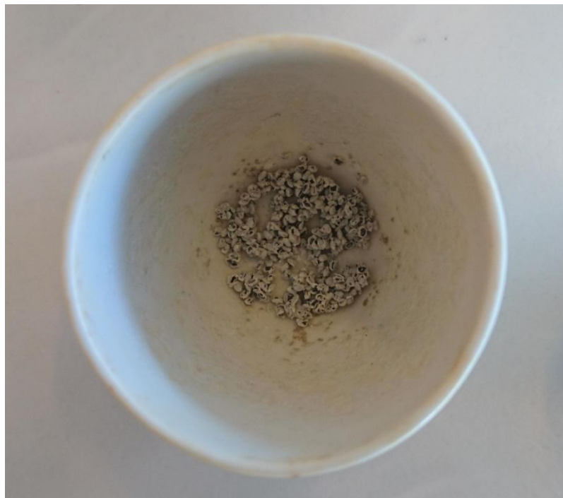
Slika 2.7. Uzorak štitaste ognjice nakon žarenja

Uzorci se spaljuju preko noći na temperaturi od 500 °C. Nakon što se izvade iz peći (slike 2.7. i 2.8.) i ohlade, uzorke je potrebno otopiti u 5 mL 20 % HCl. Ukoliko je potrebno, otopina se zagrije kako bi se sav ostatak otopio.