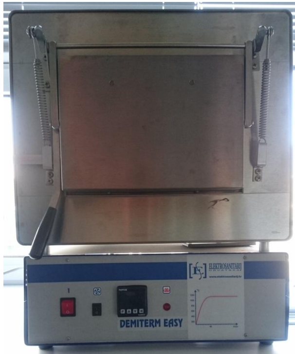
Slika 2.3. Peć Demitem Easy