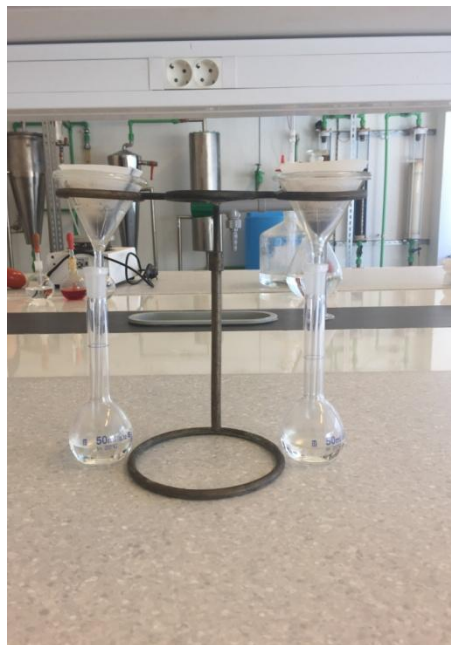
Slika 2.9. Filtriranje uzoraka

Dobivena otopina se profiltrira (slika 2.9.), a dobiveni filtrat je potrebno dopuniti do oznake ultračistom vodom u odmjernoj tikvici od 50 mL te dobro promiješati. Ovako pripremljene otopine uzoraka su spremne za daljnju analizu.