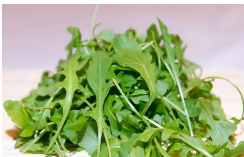
Slika 1.2. Rukola 3

Sjemenke rukole se prešaju za dobivanje ulja. Iz ulja se dobiva eruka (toksična, monozasićena masna kiselina koja se može naći i u sjemenkama uljane repice i gorušice). Neprerađeno ulje je biorazgradivo pa je dobra alternativa mineralnim uljima u industriji. Zbog sastava glukozinolata i flavonoida, rukola ima snažno antioksidacijsko djelovanje. Učinkovita je kod suzbijanja blagih bakterijskih i gljivičnih upala, a visoka koncentracija vitamina C djeluje antiskorbutski. Rukola obiluje vitaminima A i K, riboflavinom i folnom kiselinom te kalcijem, magnezijem, bakrom, željezom, cinkom i kalijem. Izotiocijanati s brojnim antioksidansima iz rukole reguliraju imunološki sustav, sprječavaju makularnu degeneraciju i osteoporozu te aktivno štite od raka. Rukola je bogata klorofilom i sumpornim spojevima koji potpomažu čišćenje organizma na staničnom nivou. Pogodna je i za kelatnu terapiju, koja se provodi radi izbacivanja teških metala iz organizma. 3