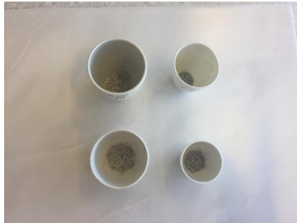
Slika 2.5. Pripremljeni uzorci

Od sjemenki odabranih biljaka (štitasta ognjica i rukola) uzme se po 1 g uzorka i premjesti u lončiče za žarenje (slika 2.5.) i prenese u peć za žarenje (slika 2.6.).