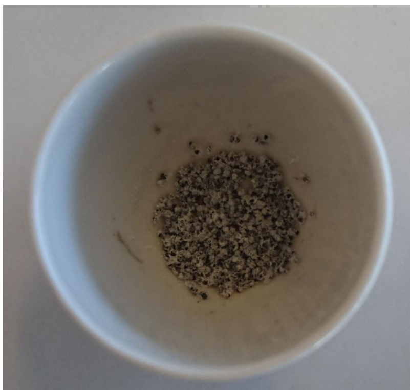
Slika 2.8. Uzorak rukole nakon žarenja