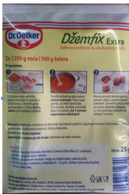
Slika 5. Deklaracija proizvoda Džemfix

Džemfix je želirno sredstvo za ukuhavanje voća. U ovom radu koristio se Džemfix Extra (Dr. Oetker), koji sadrži dekstrozu, amidirani pektin, limunsku kiselinu, sorbinsku kiselinu, te biljnu masnoću. Svi sastojci su otisnuti na poleđini ambalaže.