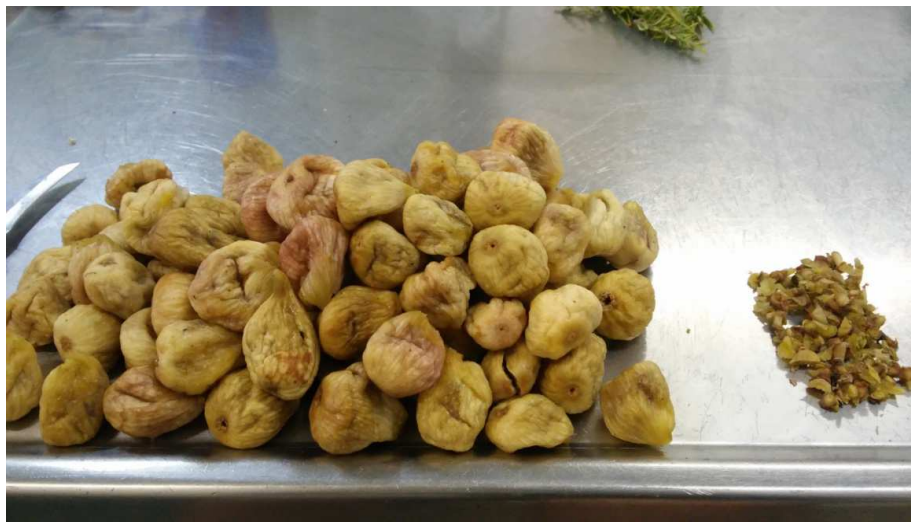
Slika 3. Očišćena smokva

Prije samog ukuhavanja voćne mase potrebno je uraditi predobradu sirovina koja uključuje njihovo pranje, inspekciju te uklanjanje peteljki i stranih primjesa (nečistoće ili truli plodovi). Druga faza je homogeniziranje sirovine tj. mljevenje nakon čega je ista spremna za daljnji proces, odnosno ukuhavanje.