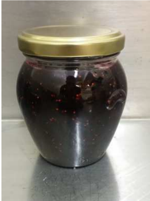
Slika 7. Džem u staklenci

(vlastita fotografija zabilježena: 30.08.2016.)