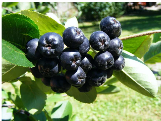
Slika 2. Crnoplodna aronija (14)