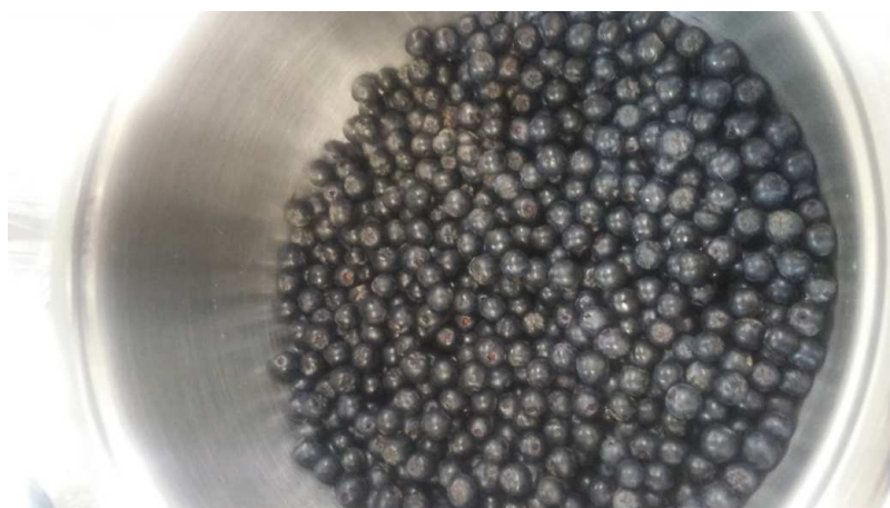
Slika 4. Očišćena aronija