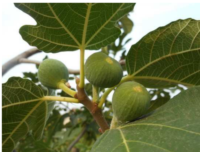
Slika 1. List i plod smokve (8)

Smokva raste kao samonikla biljka ili se pak uzgaja. To je listopadno drvo ili grm koje dostiže promjer od preko 1,5 m sa širokom razgranatom krošnjom. Kora smokve je pepeljasto siva, svijetla i glatka, obiluje gustim mliječnim sokom kao i svi ostali dijelovi biljke. Listovi su naizmjenični, polimorfni, kožasti, s gornje strane hrapavi, s donje strane malo pahuljasto dlakavi. Tamno-zeleni listovi imaju peteljke duge 3-6 cm. Vršni pupovi su jajoliki s dugim ušiljenim vrhom s 2-3 zelenkaste ljuske, a bočni pupovi su okruglasti i do 0,5 cm dugi sa više ljuski. Brojni cvjetovi su jednospolni, iznimno dvospolni, vrlo su maleni na kratkim stapkama. Dije se na 3 vrste, muški sa tri prašnika, ženski s tučkom i ženski sterilni. Korijenski sustav je dobro razvijen i prilagođava se terenu. Plodovi smokve nastaju iz čitavih ženskih cvatova, oblikom su kruškoliki, mesnati, često različite veličine, na površini goli, u zreлом stanju najčešće žuti, smeđi, ljubičasti ili potpuno tamni (7).