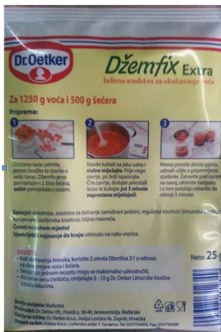
Slika 5. Deklaracija proizvoda Džemfix

Džemfix je želirno sredstvo za ukuhavanje voća. U ovom radu koristio se Džemfix Extra (Dr. Oetker), koji sadrži dekstrozu, amidirani pektin, limunsku kiselinu, sorbinsku kiselinu, te biljnu masnoću. Svi sastojci su otisnuti na poleđini ambalaže.