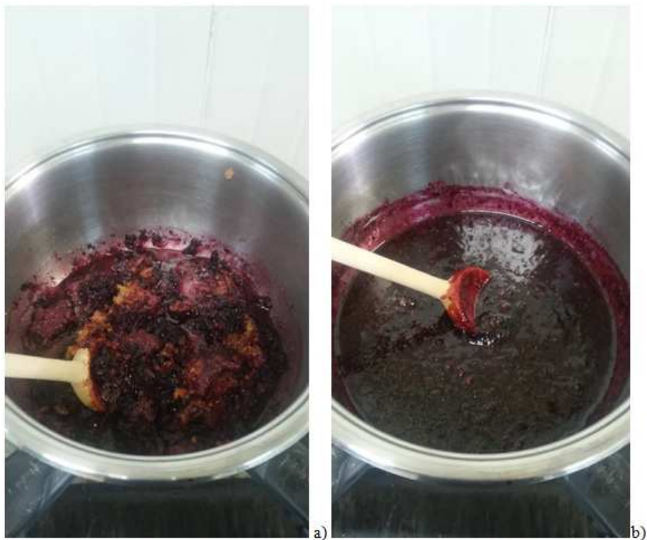
Slika 6. a) početna faza ukuhavanja b) završna faza ukuhavanja

(vlastita fotografija zabilježena: 30.08.2016.)