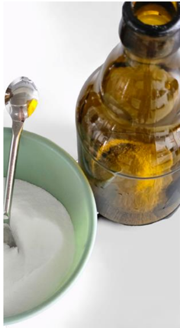
Slika 20. Dekstroza u boci