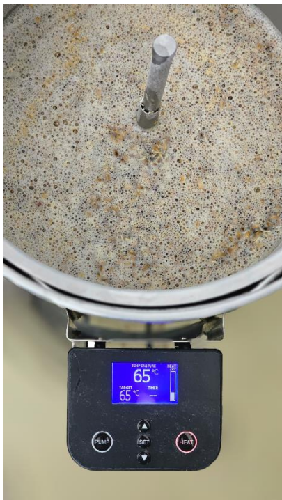
Slika 9. Ukomljavanje