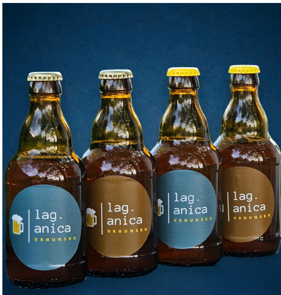
Slika 21. Finalni proizvod - pivo "Lag.anica"