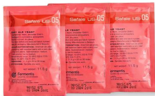
Slika 16. SafAle kvasac