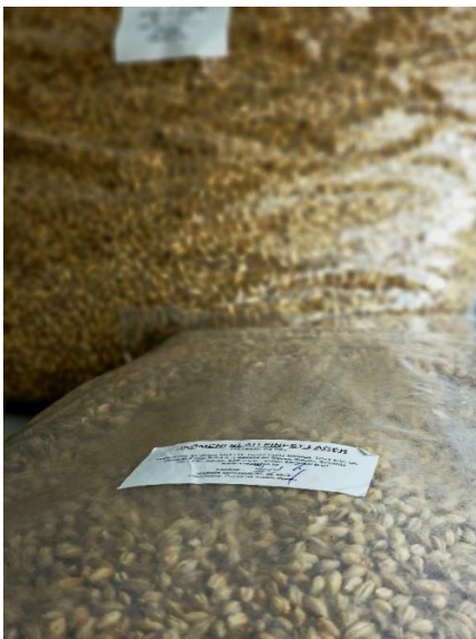
Slika 6. Ječmeni slad Finest Lager