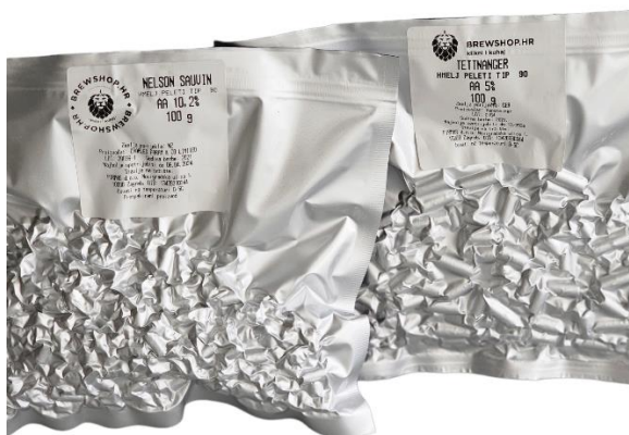
Slika 12. Hmelj "Nelson Sauvin" i "Tettnang" hmelj

Nakon uklanjanja ocijeđenog slada, sladovinu je potrebno zagrijati do 100 °C. Sladovina se kuha tijekom 20 minuta, nakon čega se dodaje hmelj „Tettnang“ (20 g) i „Nelson Sauvin“ (15 g), te se nastavlja kuhanje još 40 minuta. Prilikom dodavanja hmelja, sladovinu je potrebno miješati kako bi se smanjilo stvaranje pjene. Nakon 60 minuta, slijedi hlađenje i prebacivanje ohlađene sladovine u fermentor.