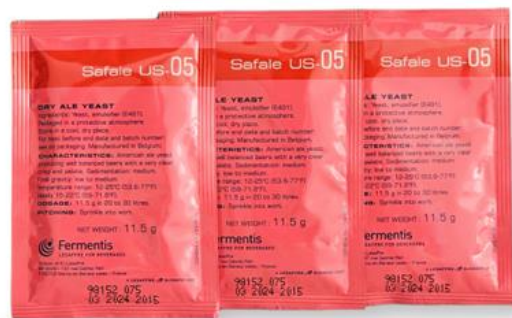
Slika 16. SafAle kvasac