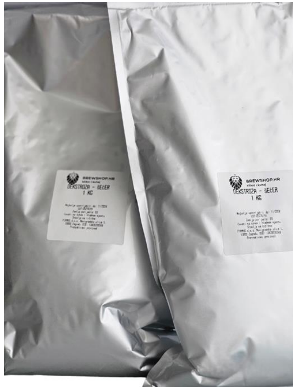
Slika 18. Dekstroza