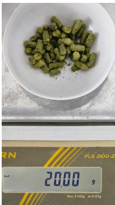
Slika 13. Vaganje hmelja