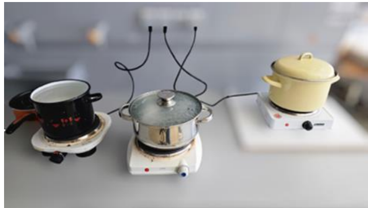
Slika 8. Zagrijavanje vode

Ukomljavanje se vrši na način da se u Grainfather G30 ulije 18,35 L zagrijane vodovodne vode. U uređaj se prethodno postavi košara s donjom perforiranom pločom. Prije početka potrebno je konfigurirati temperaturu ukomljavanja, koja je u našem slučaju iznosila 65°C ( slika 8 ). Sladovina se kuhala sat vremena pri navedenoj temperaturi, dok je 10 minuta prije kraja temperatura povišena na 75 °C. Nakon završetka kuhanja, isključi se pumpa, košara se podigne kako bi se sladovina ocijedila, te se isprala s 14,05 L zagrijane vode.