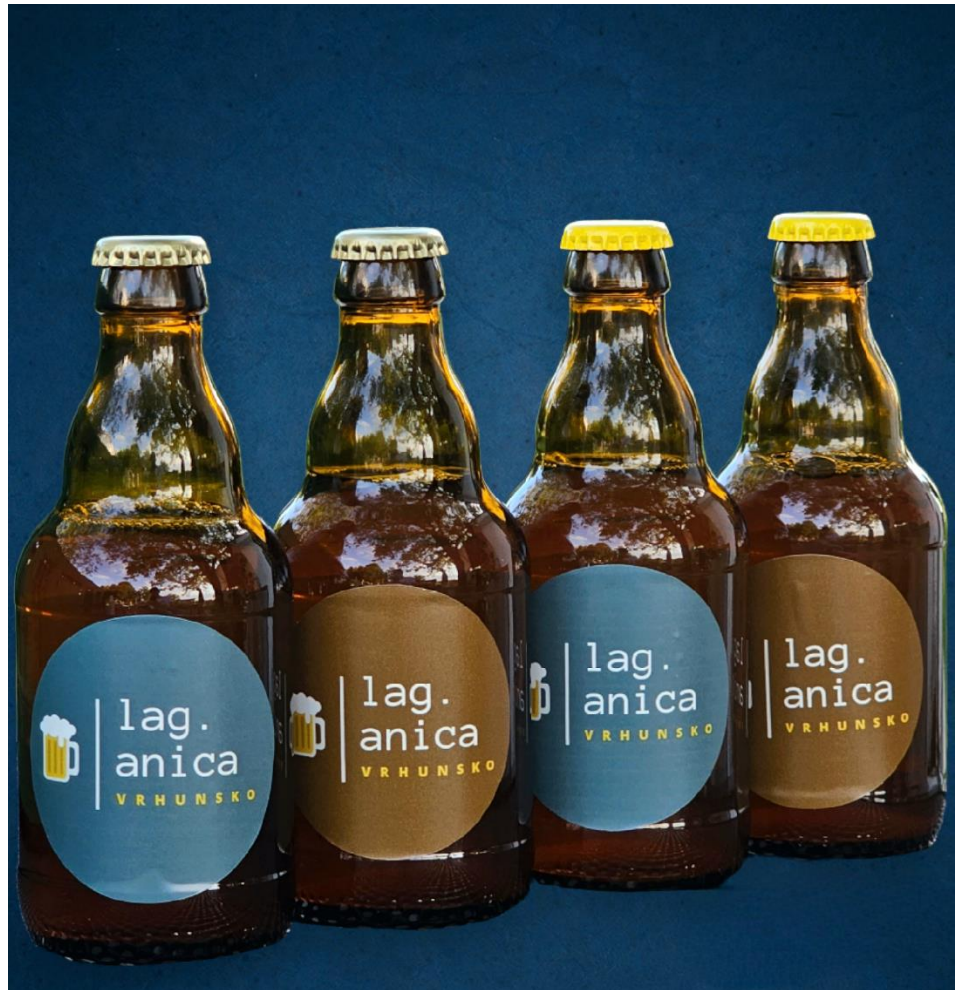
Slika 21. Finalni proizvod - pivo "Lag.anica"