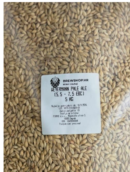
Slika 7. Ječmeni slad Pale Malt