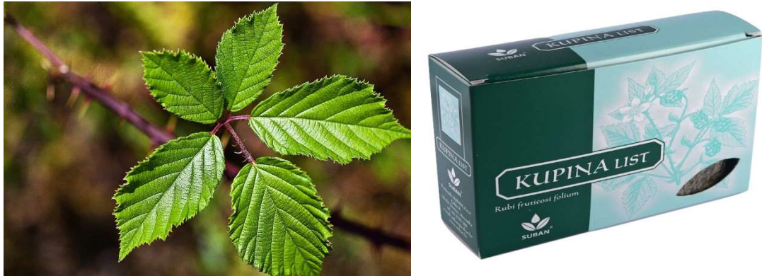
Slika 4. a) List kupine; b) Čaj od lista kupine

Zaboravljeni listovi bobičastog voća dobivaju sve širu primjenu te se mogu promatrati kao izvori vrijednih bioaktivnih spojeva čija svojstva utječu na zdravlje i prevenciju bolesti. (29)