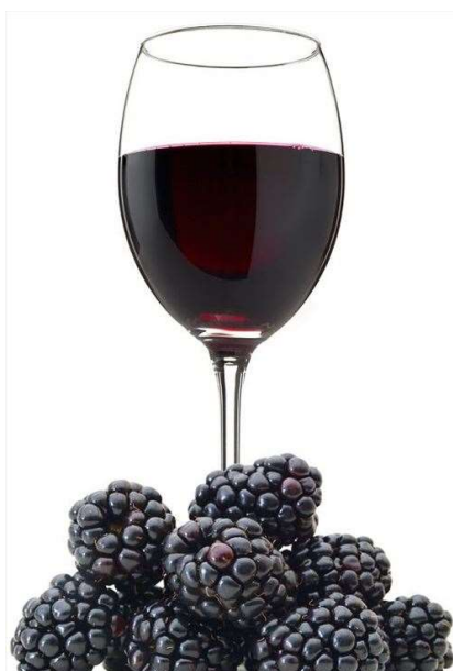
Slika 3. Kupinovo vino (27)