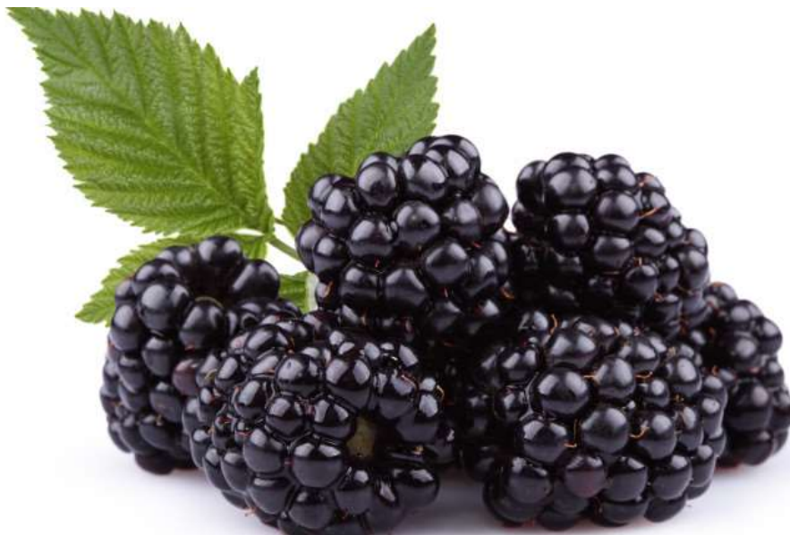
Slika 1. Plod kupine (2)

Biljka cvjeta krajem proljeća i početkom ljeta. Cvjetovi imaju više prašnika. Nakon opadanja latica, voće razvija zbirne plodove koji su u ranoj fazi zelene boje dok kasnije tijekom zrenja prelaze preko crvene u crnu boju. Boja ovisi o prirodnim pigmentima koji su prisutni u kupini te o čimbenicima kao što su sorta, agronomska praksa korištena pri uzgoju, klimatski uvjeti, enzimska aktivnost i mikrobiološka kontaminacija. List kupine je s gornje strane tamno-zelen dok je donja strana svjetlija. (1)