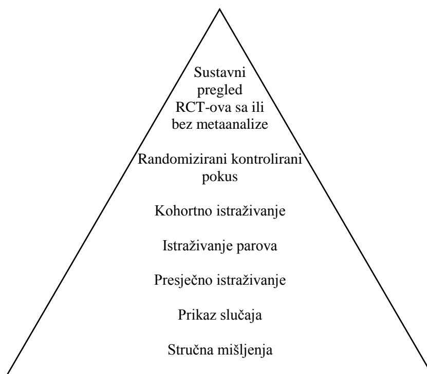
Slika 2. Hijerarhija dokaza u medicini

Postoje i drugi sustavi za procjenu kvalitete znanstvenih dokaza kao što je Centar za medicinu utemeljenu na dokazima iz Oxforda (engl. Oxford Centre for Evidence-Based Medicine ,