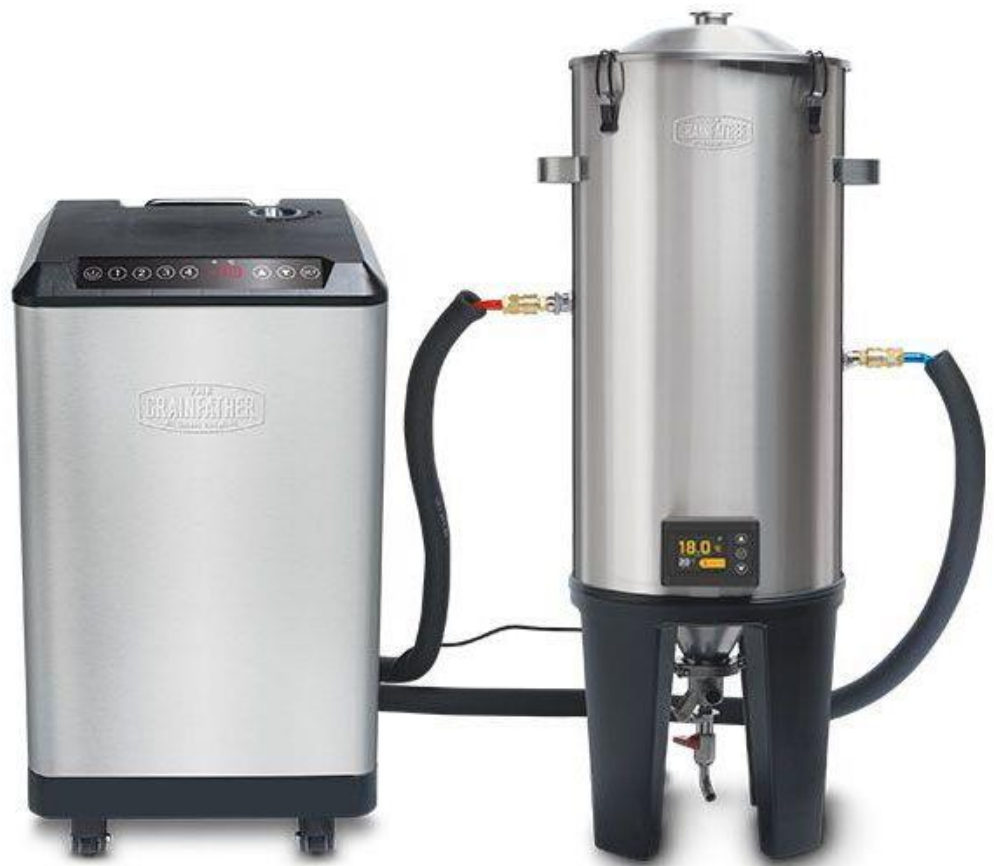
Slika 4. Glikolni rashladni uređaj GC4 (lijevo) i fermentor Grainfather GF30 (desno) 20

Budući da je kontrola temperature tijekom fermentacije ključna, fermentor ( slika 4 ) je spojen na glikolni rashladni uređaj GC4 ( slika 4 ). Učinkovitost hlađenja je poboljšana dodatkom izolacijskog plašta na GF30, no uz to smanjena je kondenzacija pri fermentaciji na niskim temperaturama. Rashladni uređaj može napajati četiri fermentora istovremeno. 20