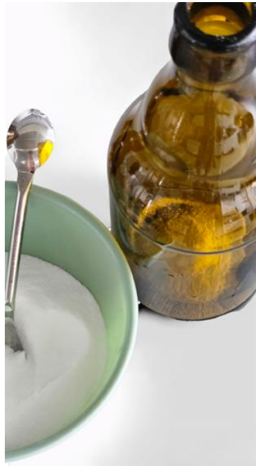
Slika 20. Dekstroza u boci