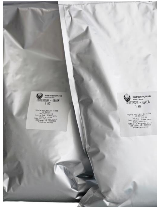
Slika 18. Dekstroza