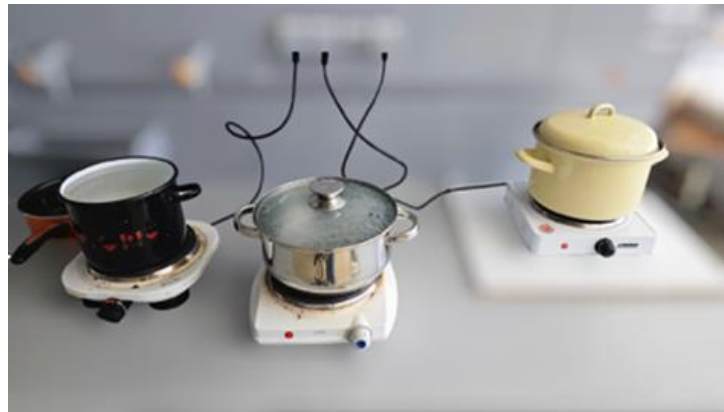
Slika 8. Zagrijavanje vode

Ukomljavanje se vrši na način da se u Grainfather G30 ulije 18,35 L zagrijane vodovodne vode. U uređaj se prethodno postavi košara s donjom perforiranom pločom. Prije početka potrebno je konfigurirati temperaturu ukomljavanja, koja je u našem slučaju iznosila 65°C ( slika 8 ). Sladovina se kuhala sat vremena pri navedenoj temperaturi, dok je 10 minuta prije kraja temperatura povišena na 75 °C. Nakon završetka kuhanja, isključi se pumpa, košara se podigne kako bi se sladovina ocijedila, te se isprala s 14,05 L zagrijane vode.