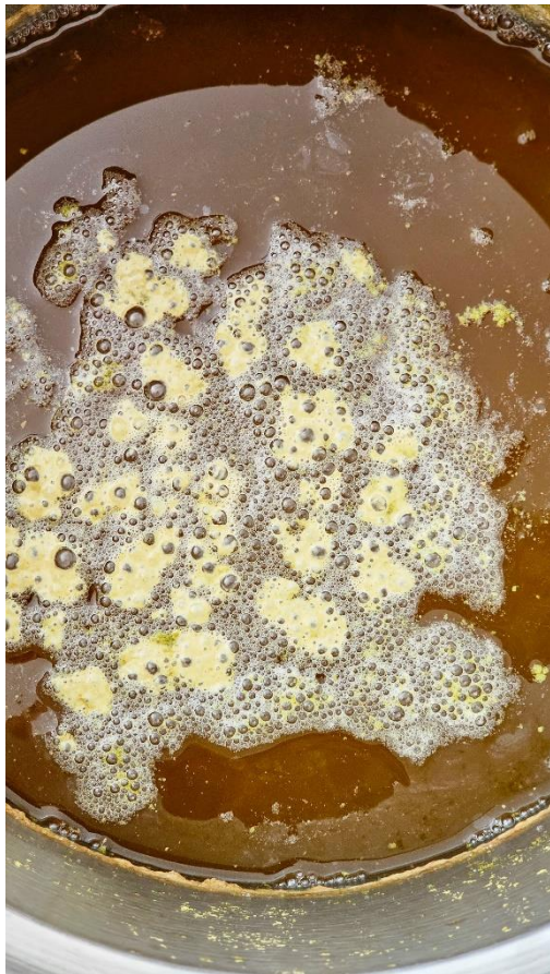
Slika 17. Izgled piva nakon završetka vrenja