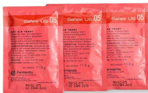
Slika 16. SafAle kvasac