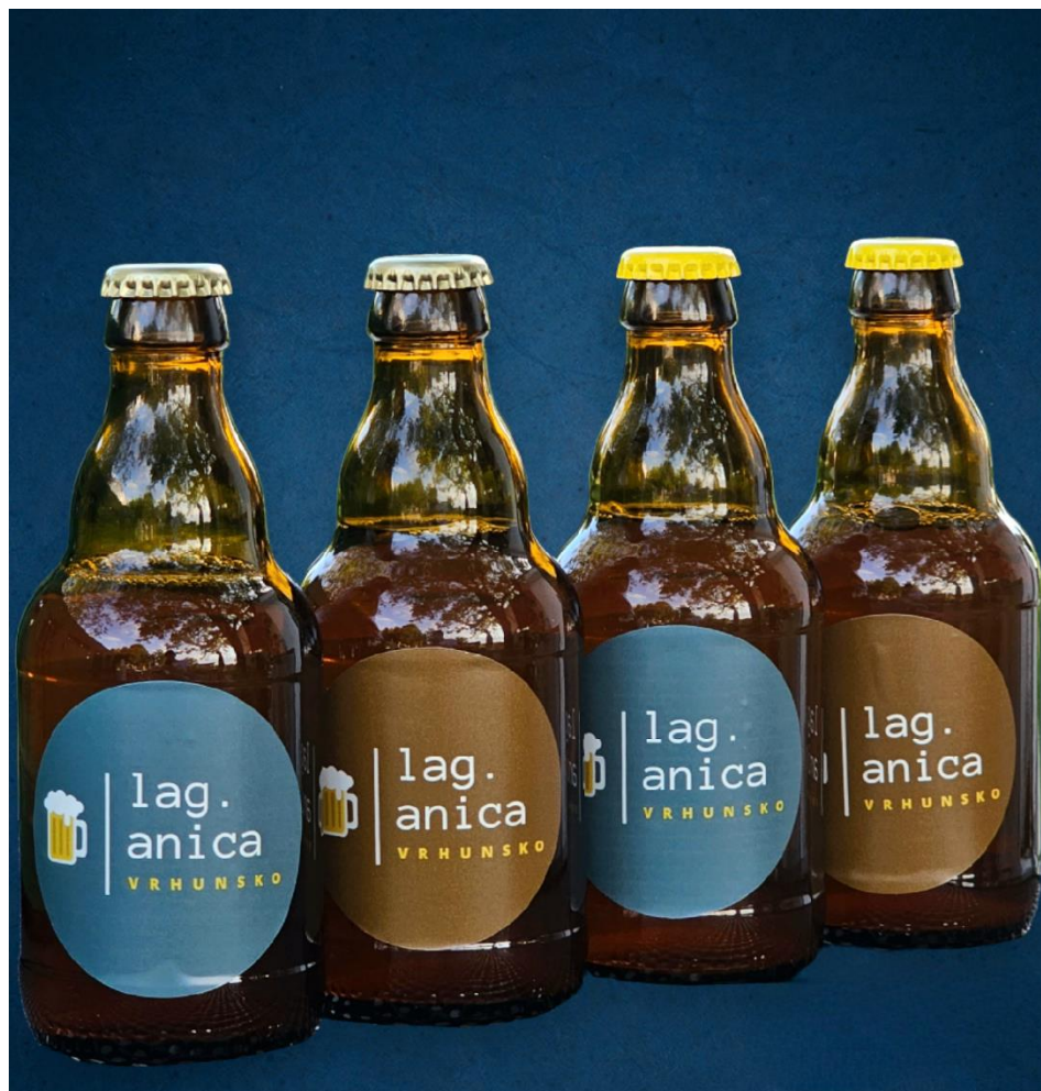
Slika 21. Finalni proizvod - pivo "Lag.anica"