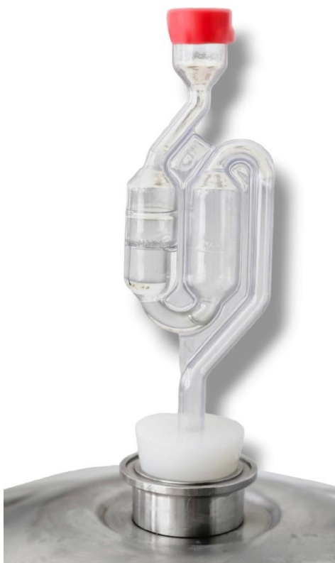
Slika 15. Vrenjača

Četiri dana prije završetka fermentacije, dodan je hmelj „ Nelson Sauvin “ u količini od 40 g, a 3 dana prije završetka fermentacije hmelj „ Tettnang “ u količini od 20 g. Dodavanje hmelja tijekom fermentacije, tzv. „ Dry Hopping “, utječe samo na aromu, a ne i na gorčinu proizvoda. Poslije završenog alkoholnog vrenja provodi se tzv. cold crush naglim snižavanjem temperature na 6 °C i zadržavanjem iste tijekom 24 sata.