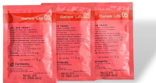
Slika 16. SafAle kvasac