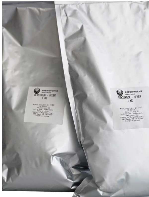
Slika 18. Dekstroza