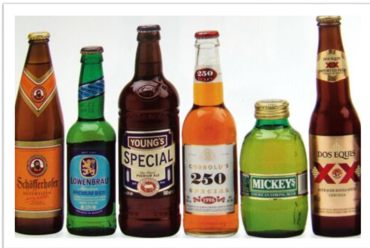
Slika 1. Različite vrste piva 12