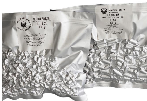
Slika 12. Hmelj "Nelson Sauvin" i "Tettnang" hmelj

Nakon uklanjanja ocijeđenog slada, sladovinu je potrebno zagrijati do 100 °C. Sladovina se kuha tijekom 20 minuta, nakon čega se dodaje hmelj „Tettnang“ (20 g) i „Nelson Sauvin“ (15 g), te se nastavlja kuhanje još 40 minuta. Prilikom dodavanja hmelja, sladovinu je potrebno miješati kako bi se smanjilo stvaranje pjene. Nakon 60 minuta, slijedi hlađenje i prebacivanje ohlađene sladovine u fermentor.