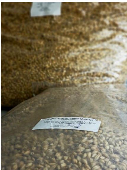
Slika 6. Ječmeni slad Finest Lager