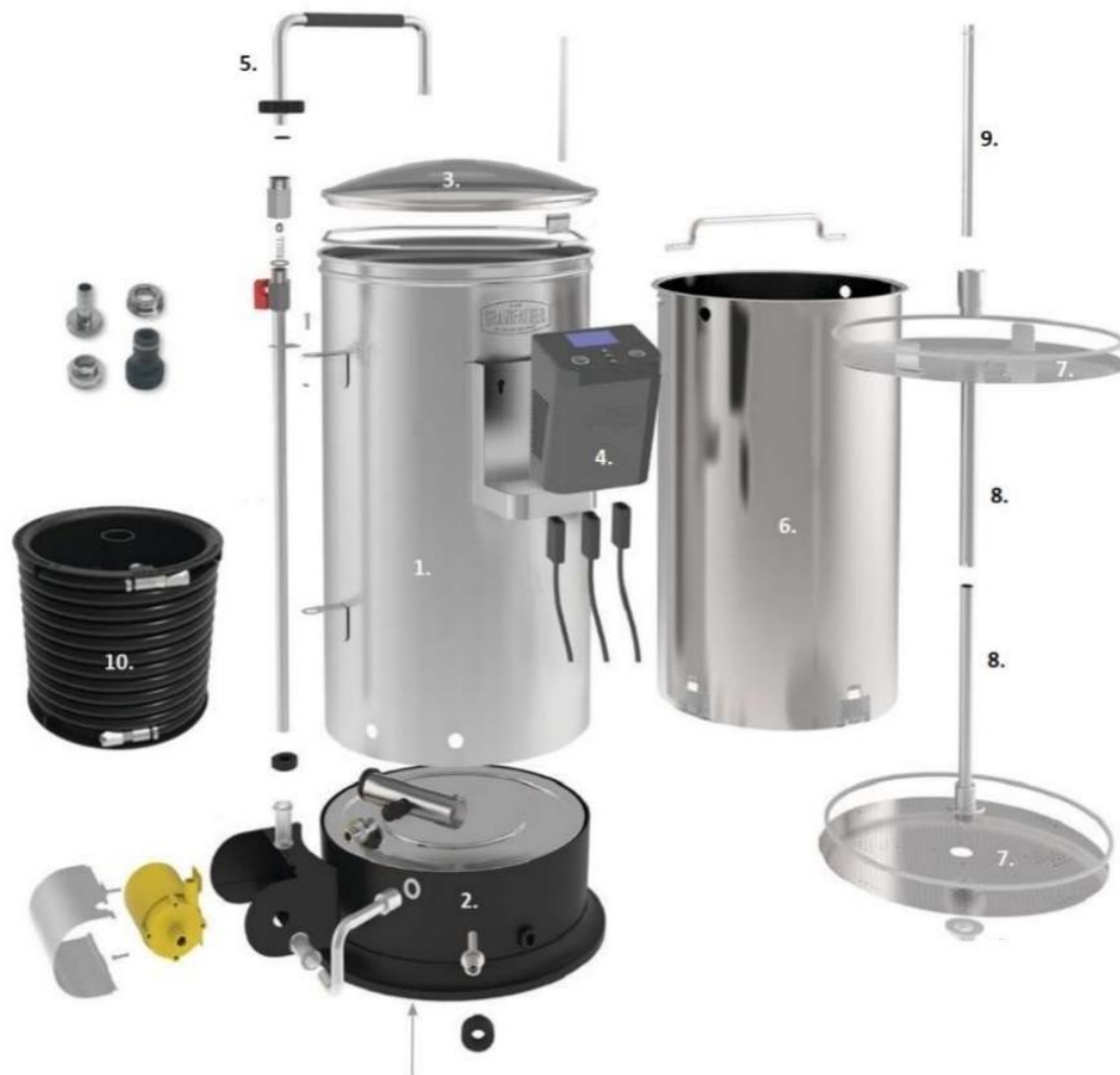
1. Tijelo kotla, 2. Podnožje, 3. Poklopac, 4. Kontrolno kućište, 5. Pumpa za cirkulaciju, 6. Unutarnja košara, 7. Perforirane ploče, 8. Cjevčice, 9. Čep i 10. Rashladni uređaj