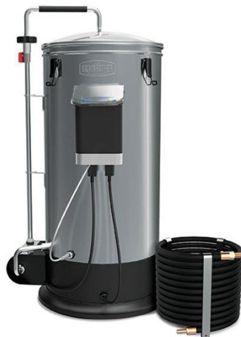
Slika 2. Grainfather uređaj 20

Uređaj se sastoji od tijela kotla, podnožja, poklopca, kontrolnog kućišta i pumpe za cirkulaciju. Također, sadrži unutarnju košaru koja služi za cijedenje i ispiranje pivskog slada. Uz košaru dolaze donja i gornja perforirana ploča, međusobno spojene cijevima čija je uloga da vrše pritisak na pivski slad što ukomljavanje čini učinkovitijim. Na vrh gornje cijevi se stavlja dodatak koji sprječava ulazak krutih čestica zrna prilikom ukomljavanja i korištenja pumpe za cirkulaciju sladovine. Po završetku kuhanja, na vrh uređaja se postavi rashladni uređaj (hladilo) koji se koristi za hlađenje sladovine neposredno prije pretakanja u fermentor. Proces se vodi i kontrolira korištenjem kontrolnog kućišta na vanjskom dijelu uređaja gdje se uključuje opcija grijanja, postavlja željena temperatura te uključuje pumpa za cirkulaciju sladovine. 20