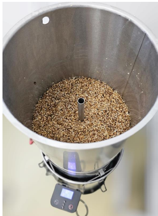
Slika 10. Cijedenje sladovine