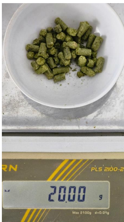
Slika 13. Vaganje hmelja