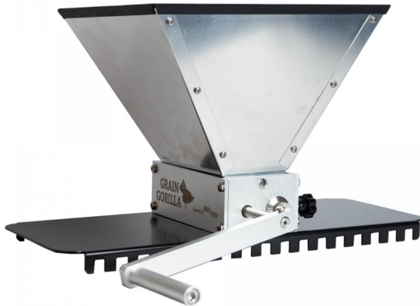
Slika 5. „Grain gorilla“ mlin

Početak proizvodnje obilježava upravo postupak mljevenja slada, a vrste slada koje su korištene su „ Pale Malt “ (3 kg) i „ Lager Malt “ (2,5 kg). Mljevenje je odrađeno pomoću „ Grain Gorilla “ mlina koji je bio podešen na širinu valjka od 1,52mm.