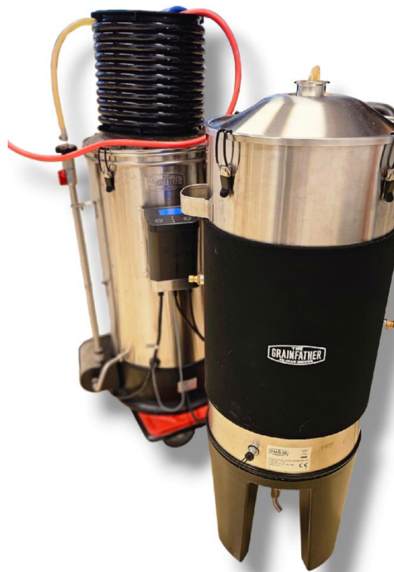
Slika 14. Fermentor spojen na spiralno hladilo

Proces hlađenja obavezan je korak prije fermentacije budući da rast kvasaca ovisi o temperaturi, a stoga i sama fermentacija. Prilikom hlađenja, Grainfather G30 spojen je na spiralno hladilo kojim se ohmeljena i ohlađena sladovina ujedno i prebacuje u fermentor.