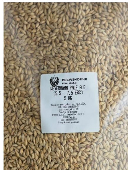
Slika 7. Ječmeni slad Pale Malt