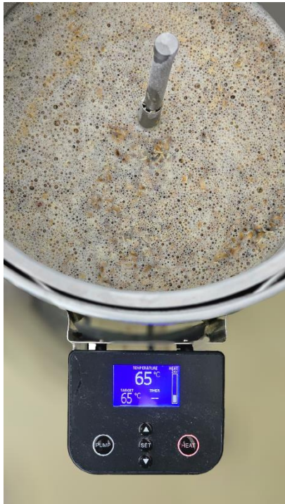
Slika 9. Ukomljavanje