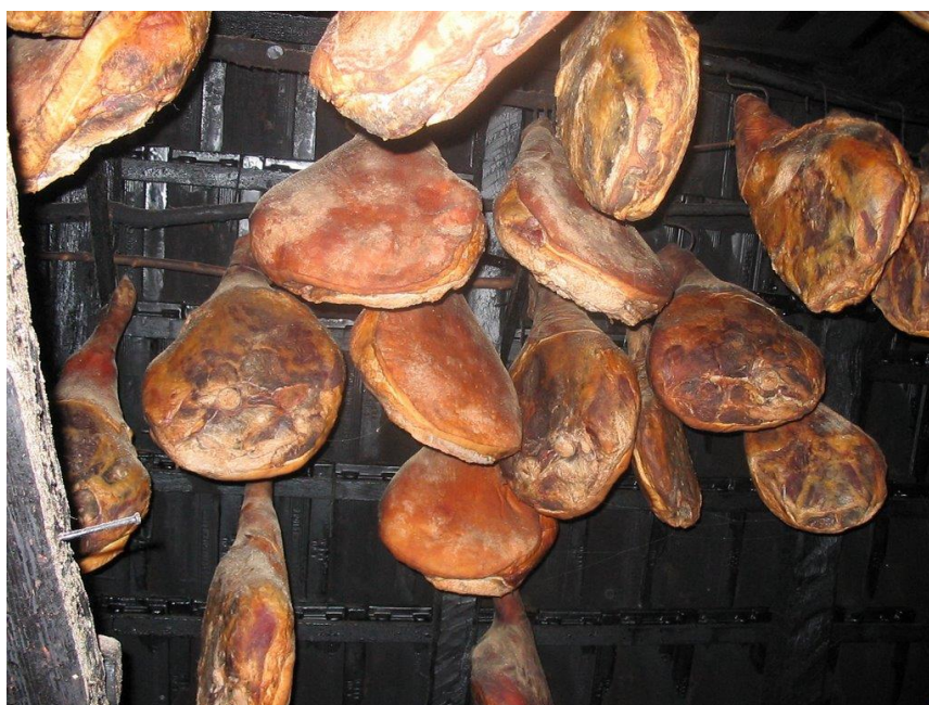
Slika 5. Dimljenje i sušenje Dalmatinskog pršuta