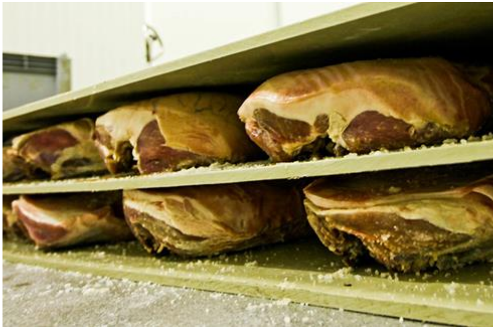
Slika 4. Prešanje Dalmatinskog pršuta

faza traje 7 – 10 dana nakon čega se butovi ispiru vodom i ocijede se, a potom slijedi dimljenje, sušenje i zrenje. Ukoliko se faza prešanja izostavi usoljeni butovi se 14 – 20 dana nakon faze soljenja ostave ležati 7 – 10 dana bez preslagivanja. Nakon toga se ispiru vodom i ocijede. Kod faze prešanja relativna vlaga mora biti viša od 80 %, a temperatura mora iznositi 2 – 6 °C.