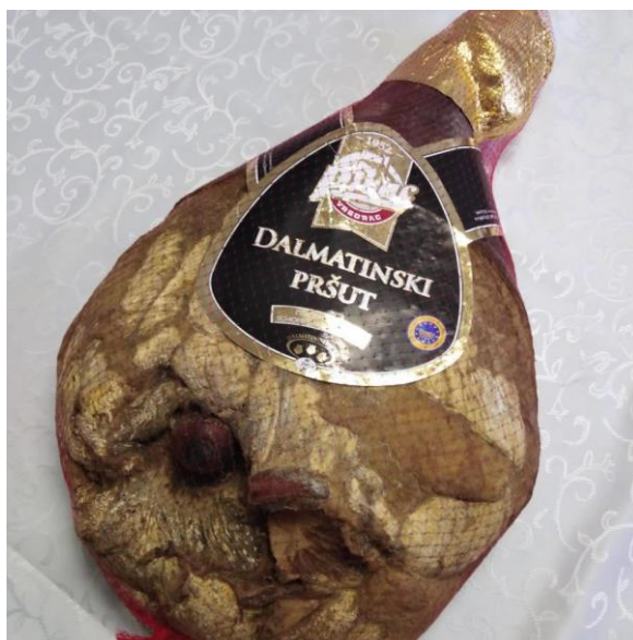
Slika 7. Upakiran cijeli Dalmatinski pršut

Proizvod s oznakom zemljopisnog podrijetla Dalmatinski pršut smije se stavljati na tržište isključivo po završetku posljednje faze proizvodnje i nakon što je certifikacijsko tijelo utvrdilo sukladnost proizvoda sa specifikacijom. Proizvod se na tržište stavlja kao cijeli pršut ili u komadima. Ukoliko se stavlja u komadima ili narezan, tj. već porcioniran u zatvorenim pakiranjima, to svako pakiranje treba biti označeno u skladu s odredbama. (3)