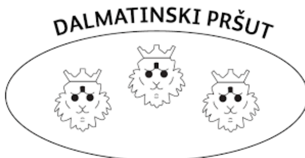
Slika 9. Grafički prikaz zajedničkog znaka Dalmatinskog pršuta

Ovalni oblik pečata unutar kojeg se nalaze tri lavlje glave, a na gornjem vanjskom obodu piše „Dalmatinski pršut“ je zajednički znak dalmatinskog pršuta.