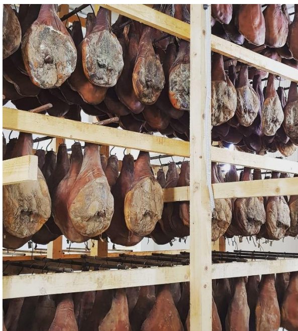
Slika 6. Zrenje Dalmatinskog pršuta