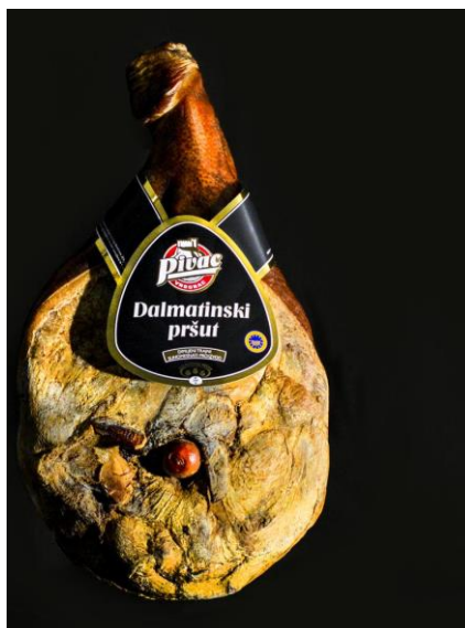
Slika 1. Dalmatinski pršut

Dalmatinski pršut se proizvodi na cijelom zemljopisnom području Dalmacije koje obuhvaća najdulji i najveći dio Hrvatskog primorja duž Jadranskog mora. Sredozemna klima s toplim i suhim ljetima te blagim i vlažnim zimama i područje Dalmacije koje je izloženo vjetrovima najveći dio godine omogućili su prirodne uvjete za optimalno zrenje i sušenje pršuta.(2)