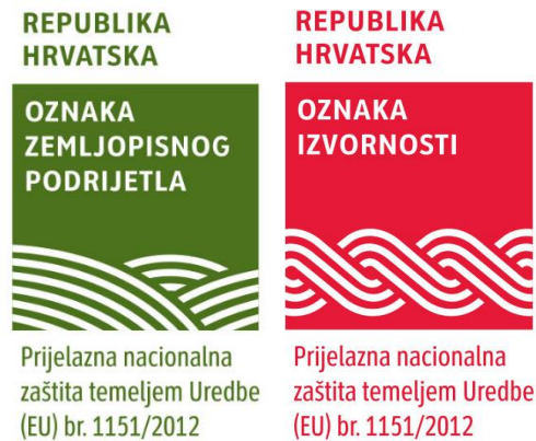
Slika 12. Prijelazna nacionalna zaštita proizvoda

komisiji dokumentaciju za postupak registracije oznake na razini Europske unije, može biti označen nacionalnim znakom tijekom perioda prijelazne nacionalne zaštite (period od podnošenja dokumentacije Europskoj komisiji pa sve do registracije oznake na razini Europske unije). Važno je naglasiti da je označavanje nacionalnim znakom dobrovoljno i da to obavlja korisnik oznake. (8)