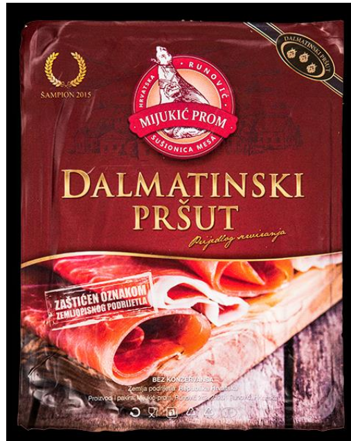
Slika 8. Upakiran narezani Dalmatinski pršut