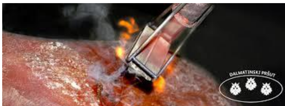
Slika 10. Žig Dalmatinskog pršuta

Za one pršute koje je ovlašteno tijelo utvrdilo da su proizvedeni u skladu s ovom specifikacijom i posjeduju sva propisana fizikalno-kemijska i senzorska svojstva zajednički znak se po završetku faze zrenja nanosi kao vrući žig na kožu.