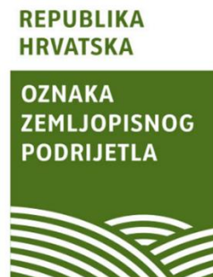
Slika 13. Primjer nacionalne oznake nakon registracije na razini Europske unije

Nakon što je oznaka registrirana na razini Europske unije, nacionalni znak se i dalje može koristiti za označavanje proizvoda, no bez navođenja tekstualnog dijela znaka „Prijelazna nacionalna zaštita temeljem Uredbe 1151/2012“.