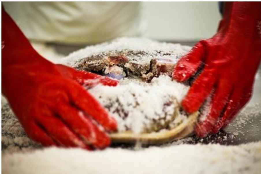
Slika 3. Soljenje Dalmatinskog pršuta

Najkritičnija točka u tehnološkom procesu proizvodnje pršuta je faza soljenja. Ukoliko se tijekom faze soljenja i prešanja ne održava niska temperatura doći će do neizbježnog smrdljivog zrenja. Pri relativnoj vlazi višoj od 80% i temperaturi od 2 – 6 °C se vrši soljenje pršuta. Prije faze soljenja obavezna je masaža odnosno stiskanje cijelog buta kako bi se istisnula preostala krv, a osobito iz femoralne arterije koja se nalazi u brazdi muskulature s medijalne strane. Ravnomjerno i brzo prodiranje soli daje nam izvrsnu kakvoću gotovog proizvoda. Da bi imali takvu kakvoću vrlo je važno da svi butovi imaju istu temperaturu (1 – 4 °C) jer tako hladni apsorbiraju manje soli jer će u protivnom doći do kvarenja. Dalmatinski pršut ne dozvoljava upotrebu začina, a soli se isključivo morskom soli. Također nije dozvoljena upotreba nikakvih konzervansa poput natrijeva nitrita (E 250), natrijeva nitrata (E 251), kalijeva sorbata (E 202), askorbinske kiseline (E 200), propionske kiseline (E 280) i sličnih aditiva. Obradeni butovi dobro se natrljaju po cijeloj površini sa suhom soli te se ostave ležati s medijalnom stranom okrenutom prema gore. Nakon 7-10 dana (ovisno o masi butova) butovi se ponovno moraju natrljati sa soli i položiti da leže idućih 7-10 dana s medijalnom stranom okrenutom prema dolje. (3)