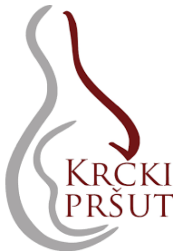
Slika 17. Grafički prikaz zajedničkog znaka krčkog pršuta