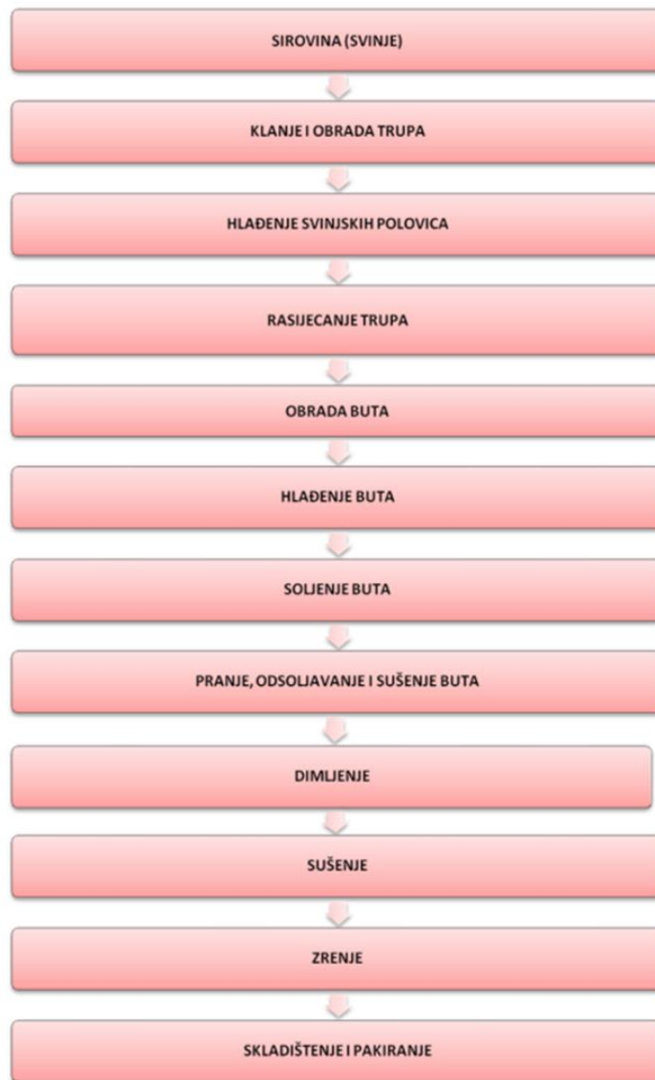
Slika 2. Blok shema tehnologije proizvodnje Dalmatinskog pršuta