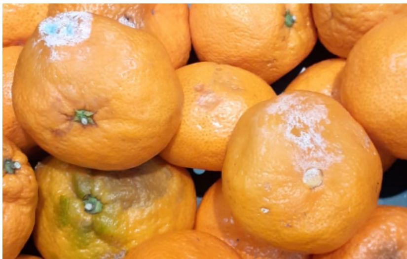
Slika 7 Simptomi plave plijesni citrusa - P. italicum

Simptomi plave plijesni - P. italicum mogu obuhvatiti samo jedan dio ploda, što je najčešće uočen simptom prilikom pregleda (Slika 7), no obično dužim čuvanjem bude prekriven cijeli plod. Dodatan problem je obilna sporulacija i širenje infekcije na susjedne plodove. Za razliku od plave plijesni, zelena plijesan na plodovima ima micelarnu prevlaku zelenkaste boje (Slika 8).