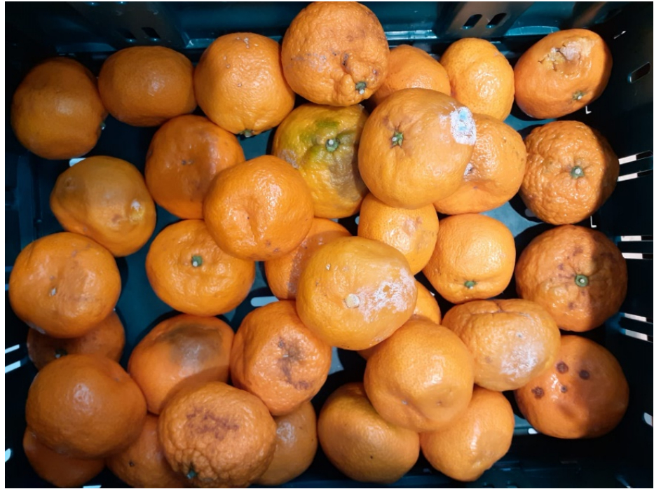
Slika 3 Izdvojeni simptomatični uzorci plodova za identifikaciju uzročnika

Simptomi crne truleži - A. alternata su najizraženiji nakon berbe iako su vidljivi i u voćnjaku kada na plodovima na mjestu spoja stapke i ploda ili na suprotnoj strani ploda, tkivo bude spužvasto, suho, svijetlo smeđe boje, a tijekom skladištenja bolest se širi u meso ploda uzduž zamišljene osi (Slike 4 i 5).