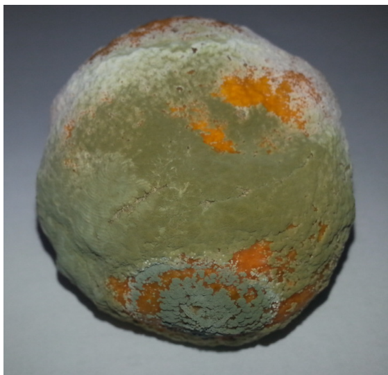
Slika 8 Simptomi zelene plijesni citrusa - P. digitatum (21)

Plodovi koji su zaraženi gljivičnim oboljenjima, uzročnicima propadanja svježih plodova, utvrđeni su u svim trgovačkim centrima. Udio takvih plodova je vrlo značajan te iznosi od najmanje 9 % do najviše 23,5 %, prosječno 16,6 %. Uzorci sa karakterističnim simptomima pojedinih gljivičnih bolesti su klasirani temeljem istih. U svim pregledanim uzorcima, utvrđene su fitopatogene gljive Alternaria alternata , Colletotrichum gloeosporioides i Penicillium italicum , dok je Penicillium digitatum utvrđen u samo jednom uzorku.