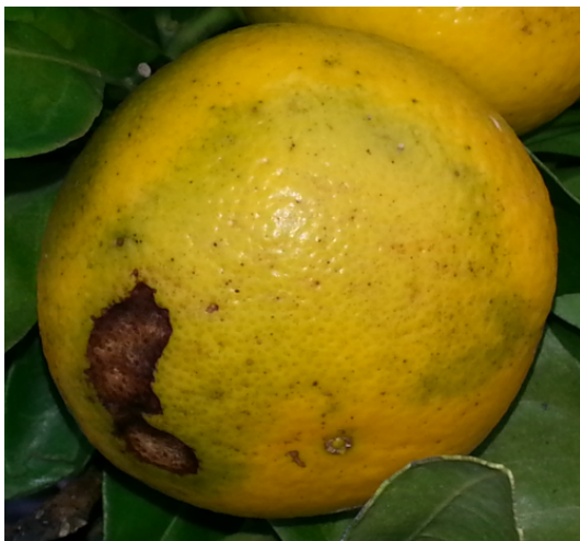
Slika 6 Simptomi antraknoze – C. gloeosporioides (21)

Slike 4 i 5 Simptomi crne truleži - Alternaria alternata na površini i mesu ploda (21)