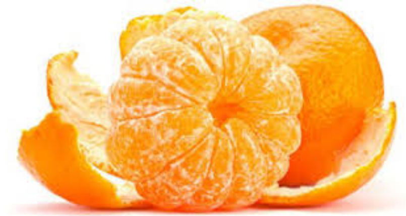
Slika 1 Plod mandarine (20)

zrenja. Vrijeme berbe ovisi o sortimentu i urodu. Početak berbe je obično zadnja dekada mjeseca rujna i tada počinju dozrijevati najranije sorte: Ichimara, Iwasaki i Zorica rana. Početkom listopada dozrijeva sorta Chahara, a sredinom mjeseca listopada sorte Kawano wase i Okitsu. Početkom studenog dozrijevaju sorte Kuno i Seto. Krajem studenog i početkom prosinca dozrijeva sorta Owari te nakon nje sorta Saigon SRA 29 (1, 4).