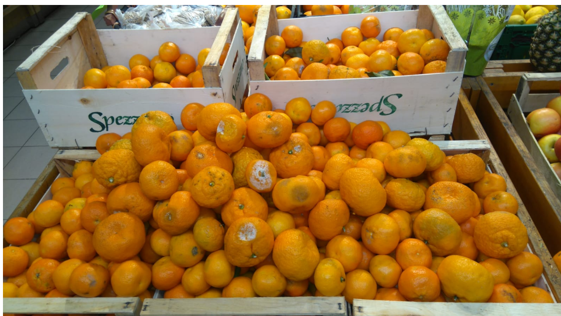
Slika 2 Plodovi mandarine sa vidljivo prisutnim zaraženim plodovima u prodaji

Utvrđeno je da se svježi plodovi prodaju jednim dijelom u rinfuzi, čuvaju na hrpama u kojima su jasno vidljivi oštećeni i truli plodovi, a nakon probiranja kvalitetnih plodova od strane kupaca, moguće je pretpostaviti da se nova količina plodova dodaje na hrpe bez izdvajanja vidljivo zaraženih plodova (Slika 2).